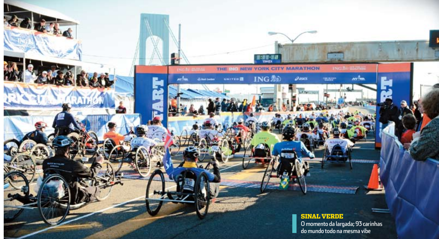
SINAL VERDE O momento da largada; 93 carinhas do mundo todo na mesma vibe