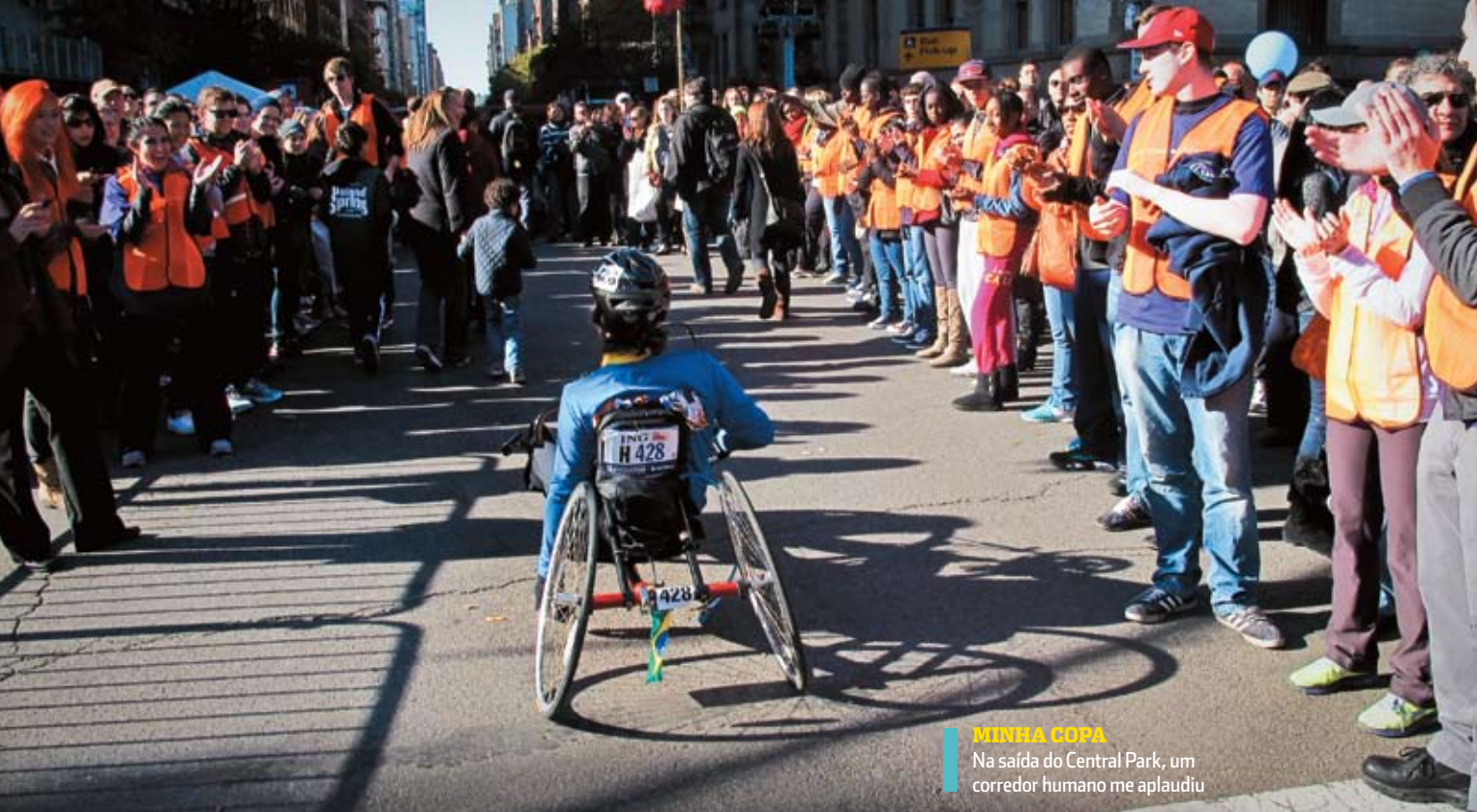
MINHA COPA Na saída do Central Park, um corredor humano me aplaudiu